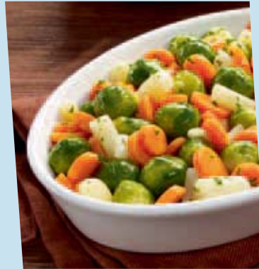
herbstliche gemüse- mischung

Inhalt: ca. 44 Stück à ca. 135 g (Karton 6 kg)