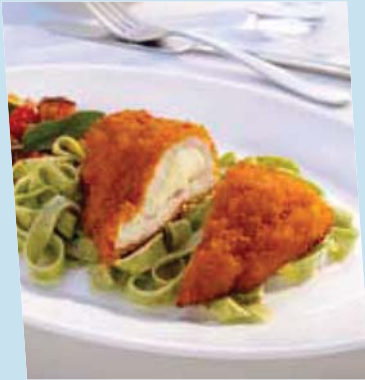
gefüllte hähn- chenbrust mozzarella