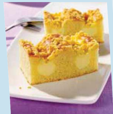
pudding- streusel- schnitte

Inhalt: ca. 100 Stück à ca. 60 g (Karton 6 kg)