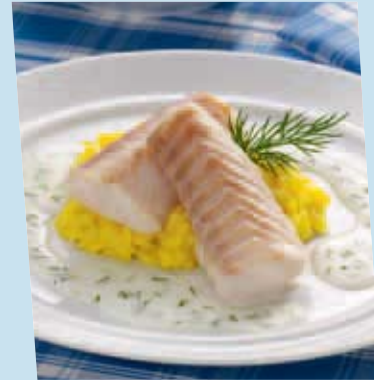
alaska seelachs loins „natur“